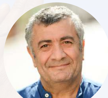
Mano Khalil Suisse - Kurdistan