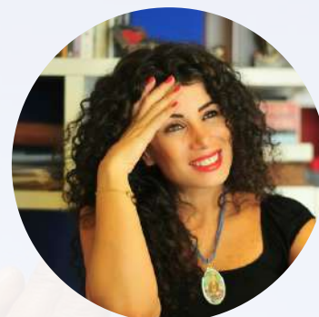
Joumana Haddad France - Liban